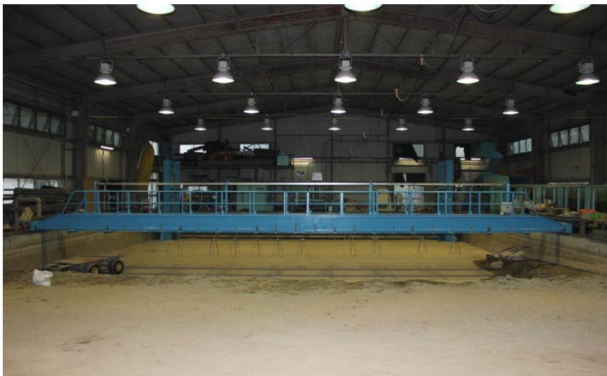
図-3 津波造波装置を搬入した後の平面波動水槽の全景

目的とする波高・周期を発生させるためのプランジャーの押し込み量が求まり、次いでその押し込み量を達成できる油圧アクチュエーターの能力の設計を行った。鋼製プランジャーは水中での浮力を差し引いても大きな重量を有しており、それを駆動できる機械の能力を設計した。プランジャーを所定の加速度で駆動するときの付加質量も考慮した。プランジャーの断面が造波時に変形しないための機械的強度、造波装置を支える鋼製フレームの機械的強度、支柱基礎の強度なども検討した。アクチュエーターを駆動する油圧ポンプユニットの能力についても計算を行った。