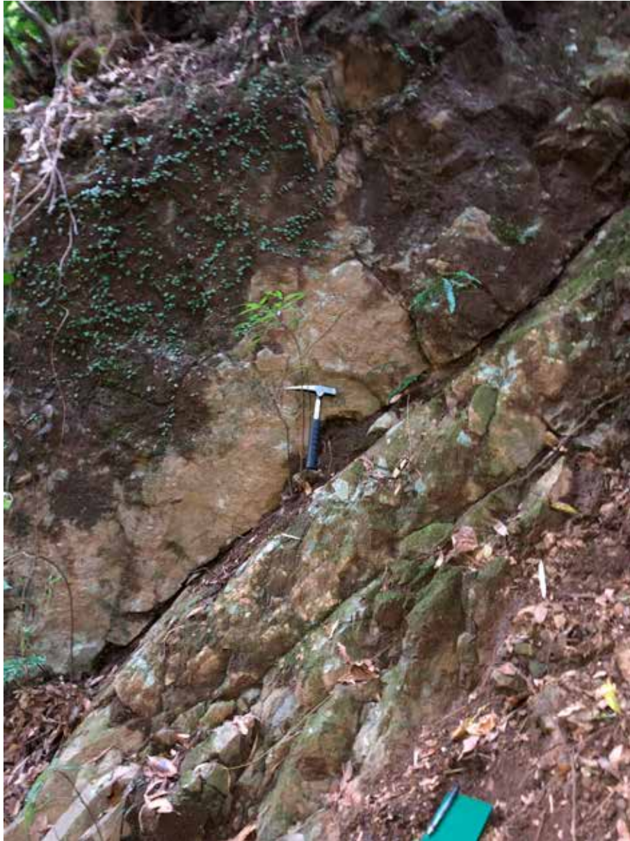
Fig.4 九州電力（2015）で断層として記載された北薩火山岩類の中の亀裂 （いちき串木野市河内）

開口割れ目で亀裂を挟んだ岩盤をパズルのように合わせることもできるので、断層運動による断層面ではなく、表層崩壊による亀裂と考えられる。