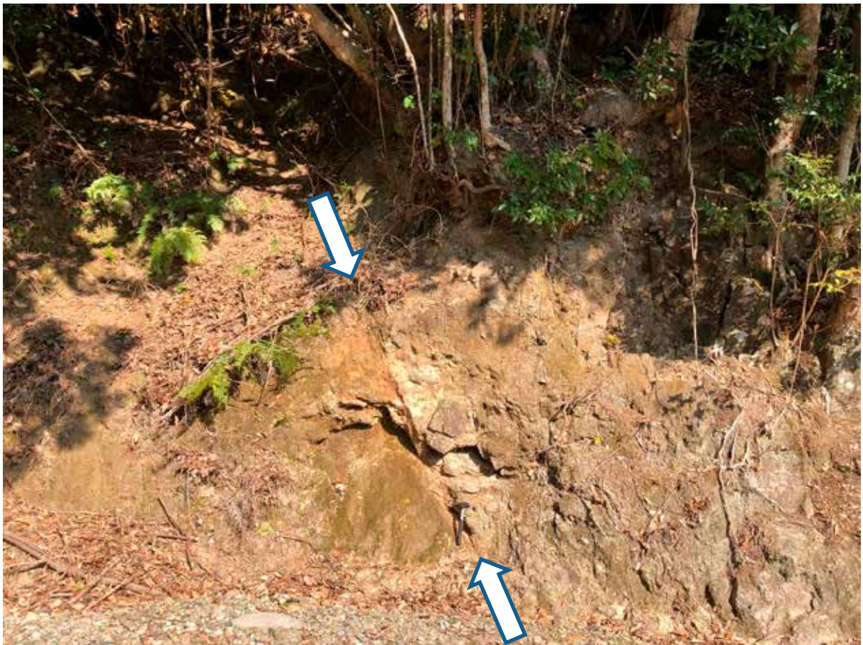
Fig.3 北薩火山岩類中に見られる断層 (薩摩川内市樋脇町市比野阿母峠付近)